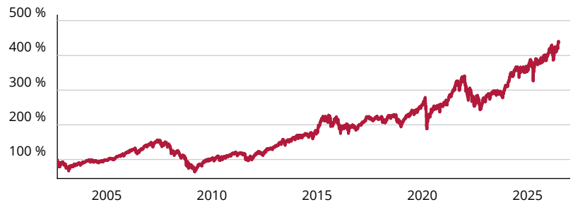
— ODDO BHF Algo Sustainable Leaders CRW