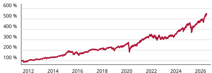
— State Street SPDR MSCI All Country World Investable Market ETF