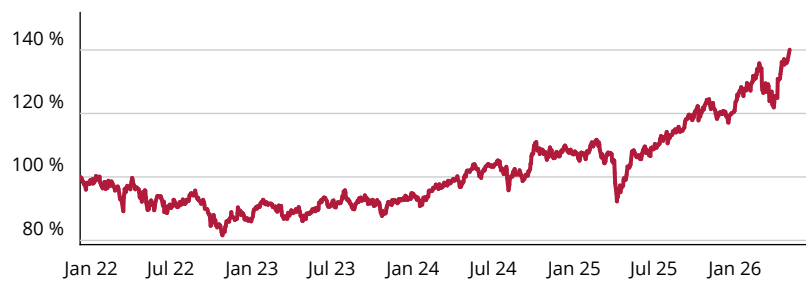
— Dimensional Emerging Markets Core Equity Lower Carbon ESG Screened Fund