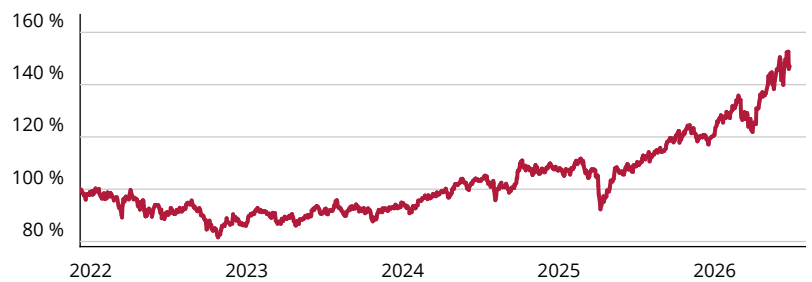
— Dimensional Emerging Markets Core Equity Lower Carbon ESG Screened Fund