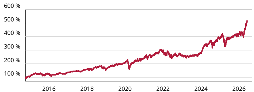
— iShares Edge MSCI World Momentum Factor ETF