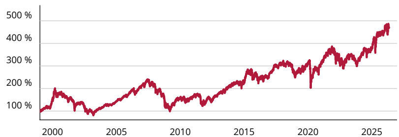
Schroder ISF Euro Equity A