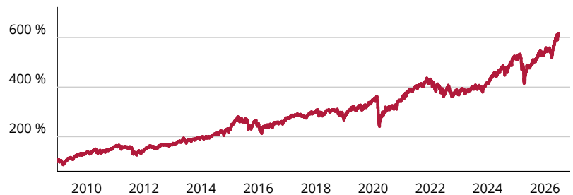
— Fidelity Funds - Fidelity Target 2040 Fund P