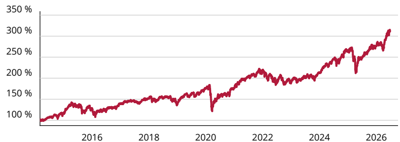
— Fidelity Funds - Fidelity Target 2045 Fund P