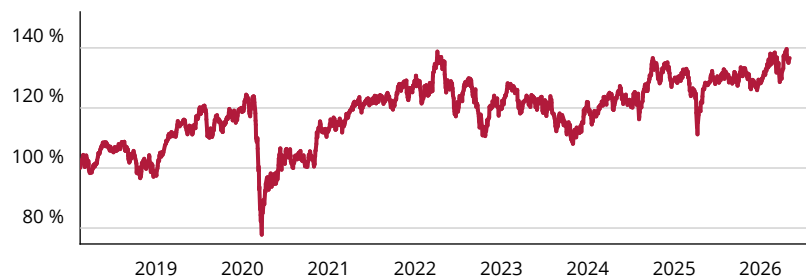
— Amundi MSCI Pacific Ex Japan SRI Climate Paris Aligned ETF