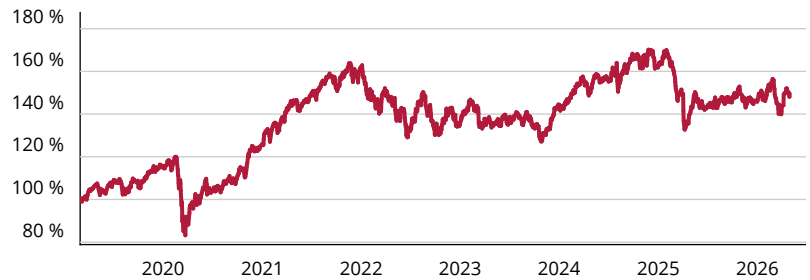
— CT (Lux) SDG Engagement Global Equity R